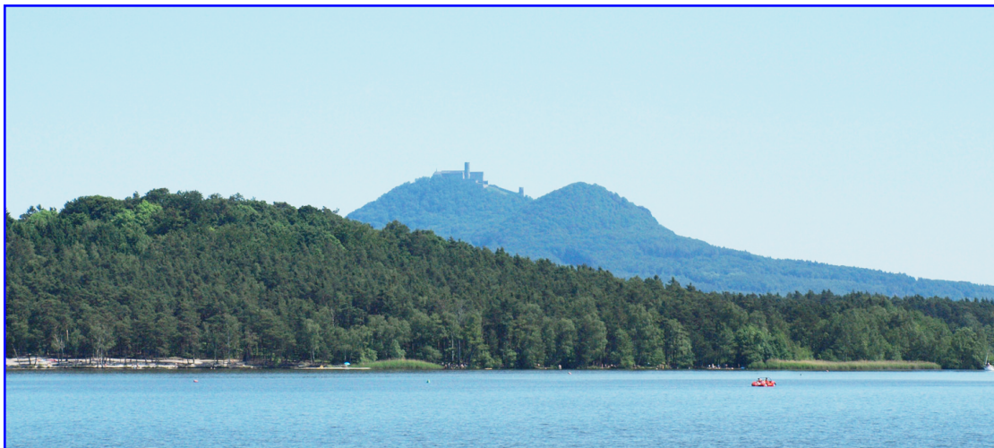
Máchovo tzv. jezero

Pěšky jsem pak došel kolem bývalé Šťastného hospody až k bývalému kravínu (dnes dvě chalupy) a shledal louky, na nichž jsem kdysi koňmo pásal šedesát jalovic, zaplevelenou prerií. Obchvatem jsem